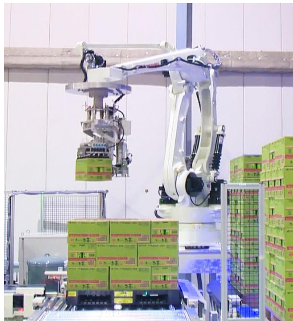
新開発ケースピッキングロボット

東洋メビウス株式会社（以下東洋メビウス）は、富士川物流センター（静岡県富士市）にて新開発ケースピッキングロボットの稼働を開始しました。