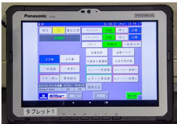
タッチパネル方式モバイルタブレット